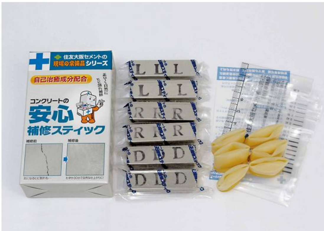
写真1：製品パッケージおよび内容品