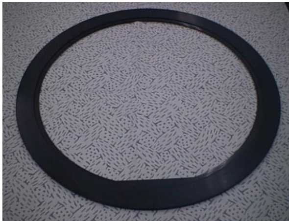
Fig.1 フォーカスリング