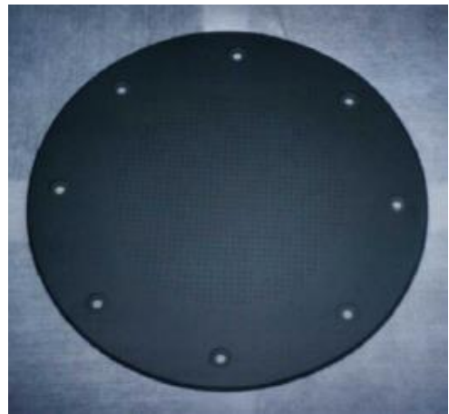
Fig.2 シャワープレート