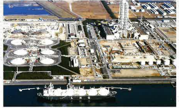
富士火力発電所 [東京電力(株)/千葉県]

水砕高炉スラグ微粉末を混合材として用いたセメントです。近年、高炉セメントは化学抵抗性に優れ、長期強度の発現が良好なため、一般土木工事用として河川・港湾・ダムなどに広く使用されています。なお、高炉スラグの分量により、A種・B種・C種が、JIS R 5211で規定されています。