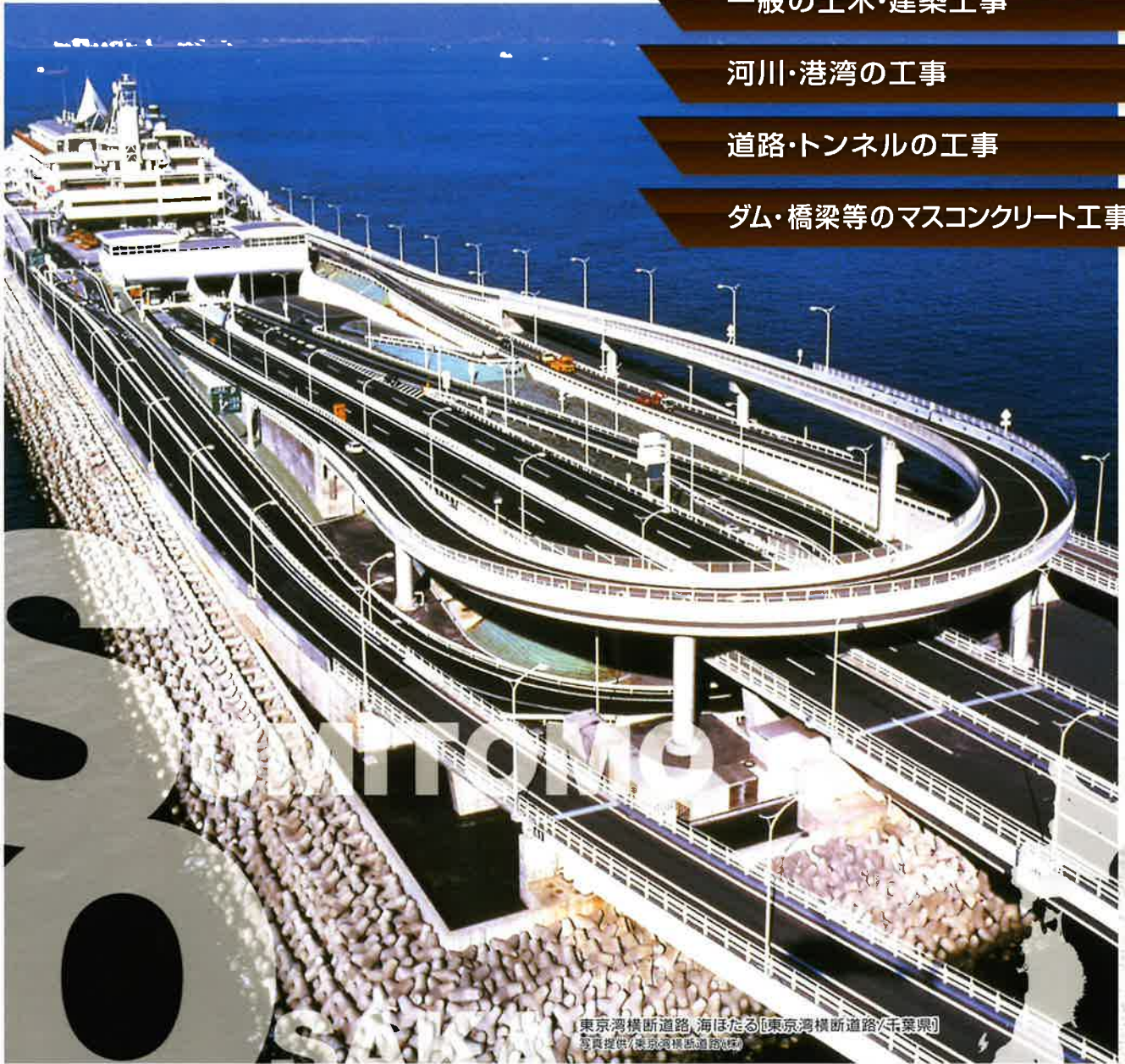
東京湾横断道路、海ほたる[東京湾横断道路/千葉県]