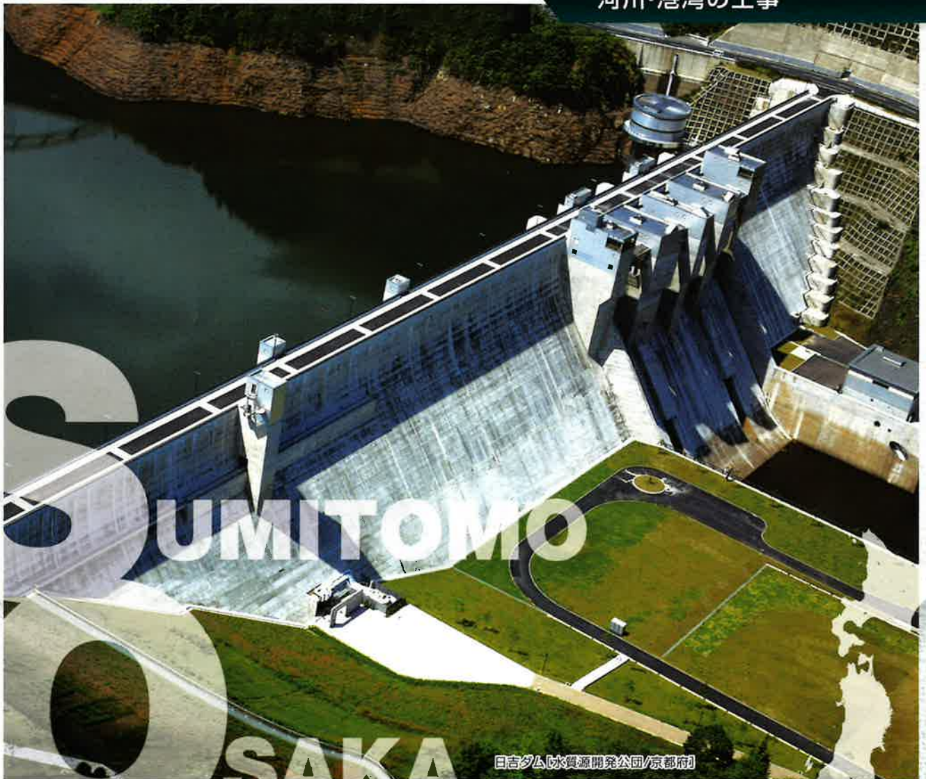
日吉ダム(水資源開発公団/京都市)