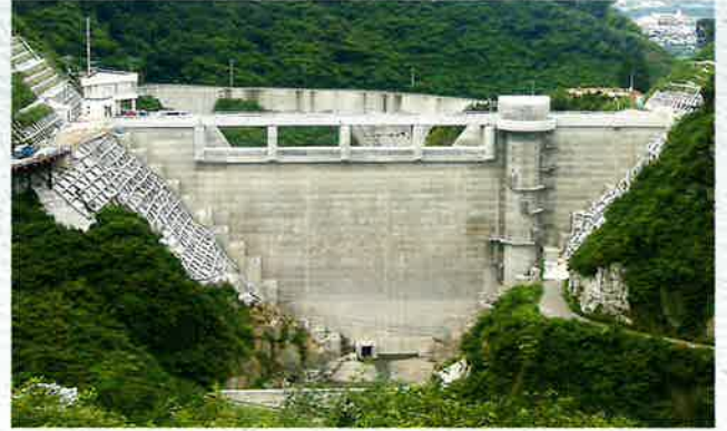
志河川ダム [中国四国農政局/愛媛県]

中庸熱ポルトランドセメントをベースにしたフライアッシュセメントです。汎用フライアッシュセメントにくらべ、水和熱がさらに低く、長期強度に優れることから、ダムコンクリート工事に使用されています。