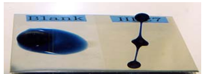
図2 水中での油の離脱状況(右半分を親水性コーティング処理)

本コーティングはステンレスに対して適用可能です。ステンレスに対しては透明な被膜を形成し、指紋・水あか・油などの汚れの水による除去が容易になります。この性質は、家電製品や建材への応用が期待されると考えられます。図2は水中で油が離脱する様子、図3は水あか汚れの付着の様子です。図3ではスポンジ（メラミンフォーム推奨）による水拭きだけで明らかな汚れ落ちの差が認められました。